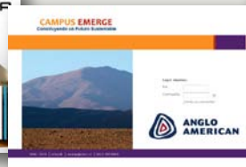
Campus Emerge Anglo American